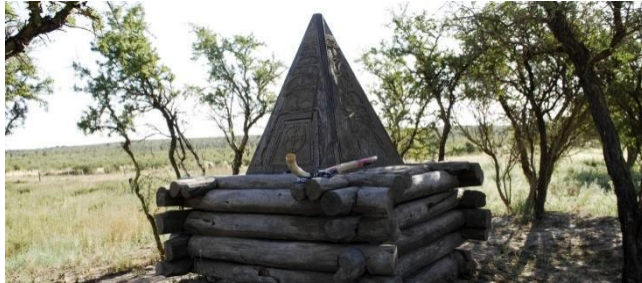
Tumba de Mariano Rosas (Panguitruz Gner) en Leuvucó, La Pampa.