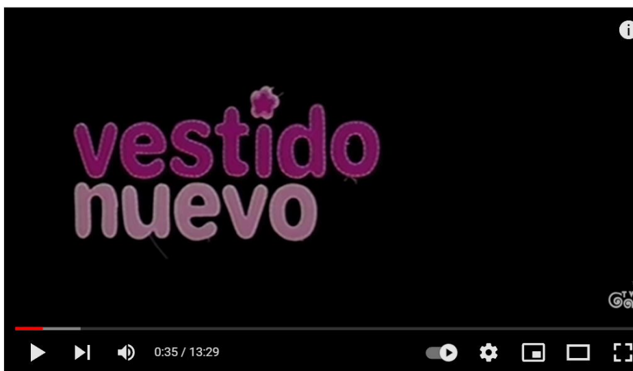
Vestido Nuevo - Corto - LGTB - España - ( 2007 )