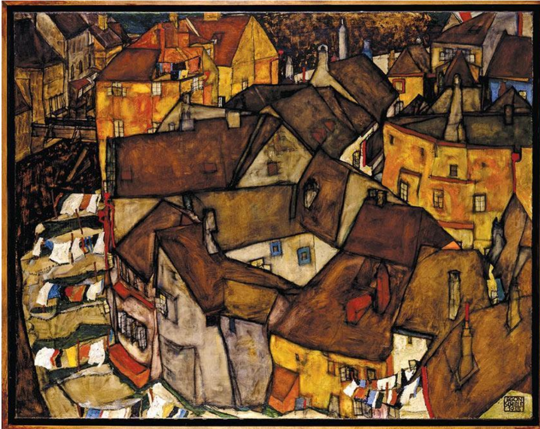
Krumau – Crescent of Houses de Egon Schiele