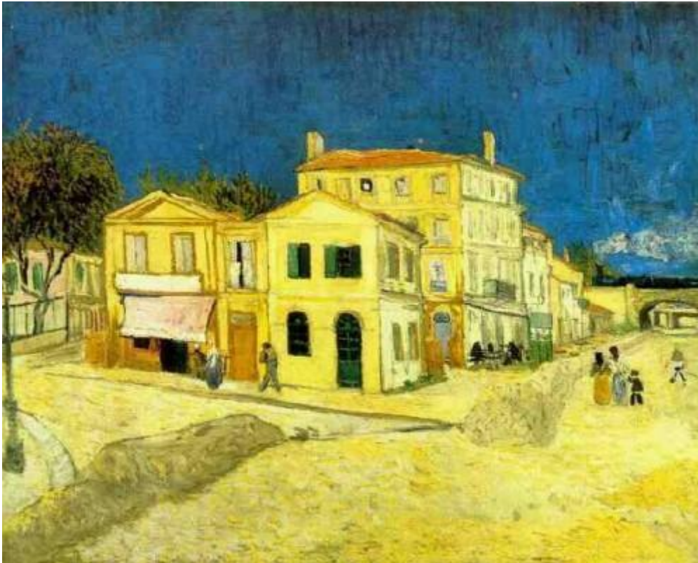
La casa amarilla de Arlés de Vincent Van Gogh