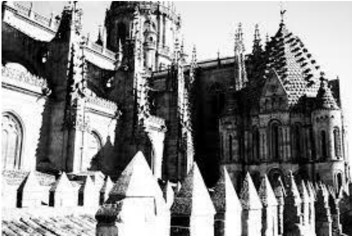
Torre del Gallo, Catedral de Salamanca. Siglo XII. Denominada así por la veleta en su cumbre.

Casa de Gobierno Segundo Piso – Santa Rosa – L.P. – email: dirección.inicial@mce.lapampa.gov.ar