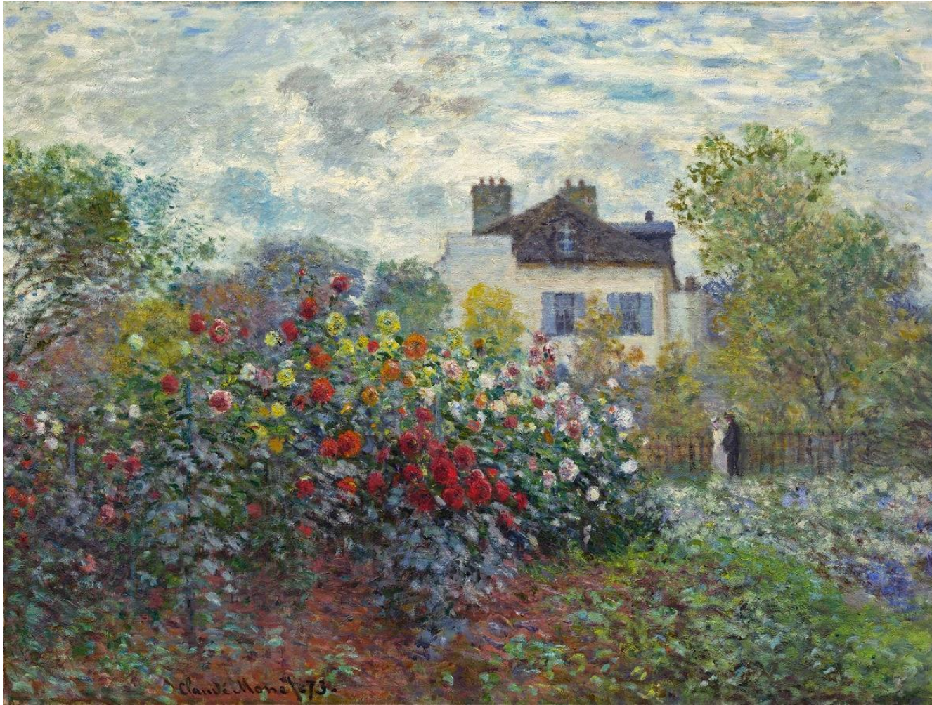
El Jardín del Artista en Argenteuil de Claude Monet