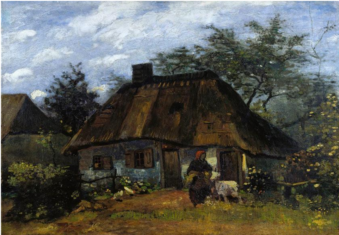
La granja en Nenuen de Vincent Van Gogh