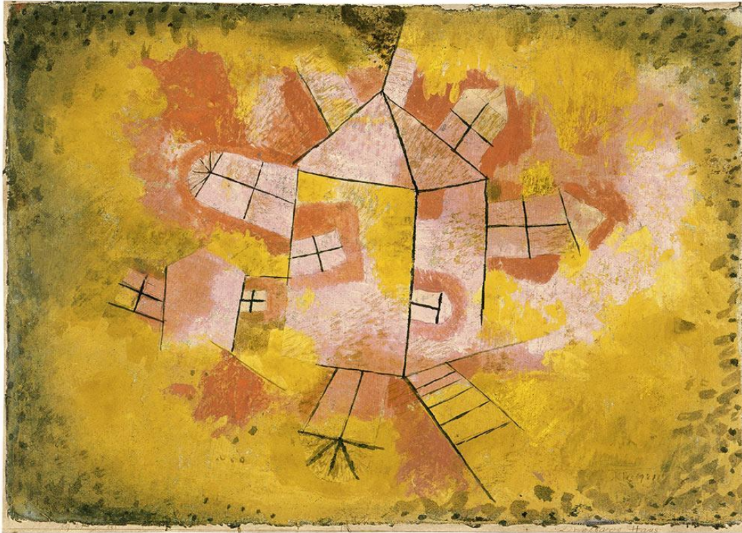
La casa giratoria de Paul Klee