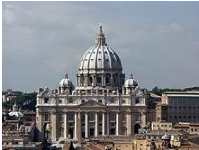
Basílica San Pedro, Roma. Cúpula